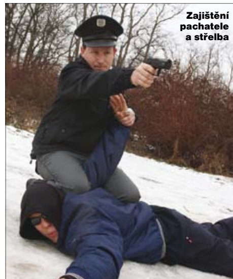
Zajištění pachatele a střelba